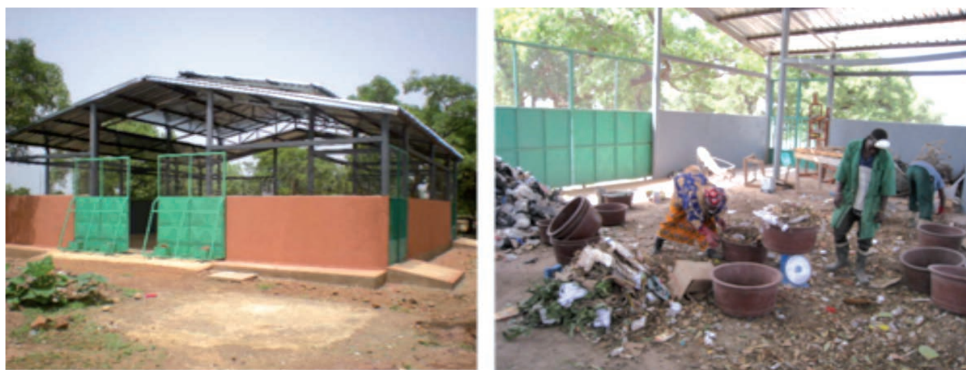
Photo centre de tri : les opérations de tri sont manuelles et fastidieuses

Un centre de tri est une installation dans laquelle les différentes fractions des déchets collectés sont séparées en vue de leur traitement/valorisation. On entend par tri toute opération visant à séparer les unes des autres les catégories, voire les sous-catégories de matériaux contenus dans les déchets (verre, papier, carton, plastiques, terre, etc.)