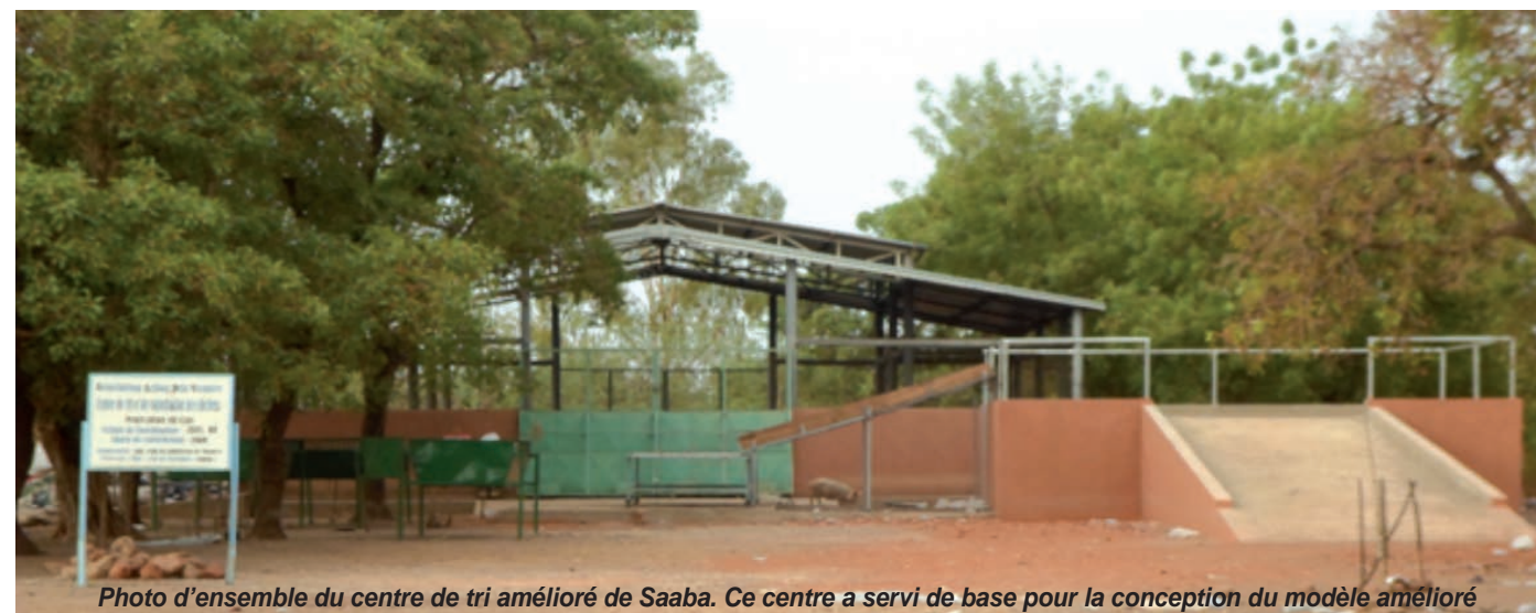
Photo d'ensemble du centre de tri amélioré de Saaba. Ce centre a servi de base pour la conception du modèle amélioré

Déchets ménagers, nettoyage issue des marchés et espaces publics, déchets vert