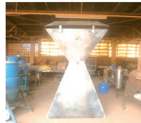
Figure 7 : la cheminée et ses accessoires

La figure suivante présente la cheminée et les installations annexes qui l'accompagnent.