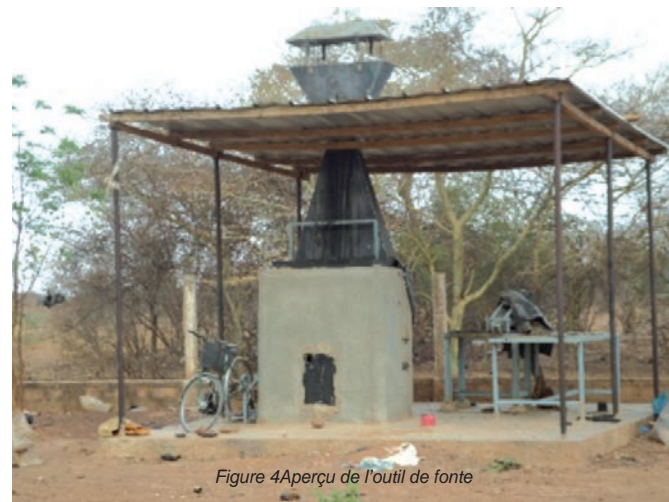
Figure 4: Aperçu de l'outil de fonte

C'est un ensemble intégré de constructions métalliques et de maçonnerie qui donne au final à l'outil, l'apparence d'un four. Sa structure interne comprend un dispositif pour la combustion, le malaxage et le mélange des sachets plastiques avec le sable. Le tout est entraîné par un vélo muni d'un système d'arbre de transmission. Un compacteur, une table de refroidissement, une cheminée avec un filtre viennent compléter le dispositif.