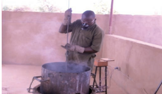
Figure 3 : Système artisanal de l'opération de fonte

Ce système de production comportait des risques pour les opérateurs (exposition à la fumée, à la poussière et à la flamme) mais aussi sur l'environnement (pollutions de l'air).