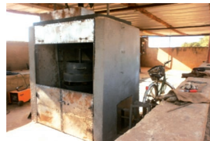
Figure 7 : la cheminée et ses accessoires

La guérite est une construction enveloppant l'ensemble du dispositif hormis le vélo et son support. Elle est conçue pour maintenir la chaleur et assure la protection des opérateurs de la chaleur et des fumées. Les murs de la guérite ont une dimension intérieure de 1200 mmx1000 mmx 1700 mm réalisée avec des briques pleines de 200 mm x400 mm x120 mm. L'extérieur de la guérite est enduit et l'intérieur brossé avec du ciment d'un dosage fort pour permettre de conserver la chaleur.