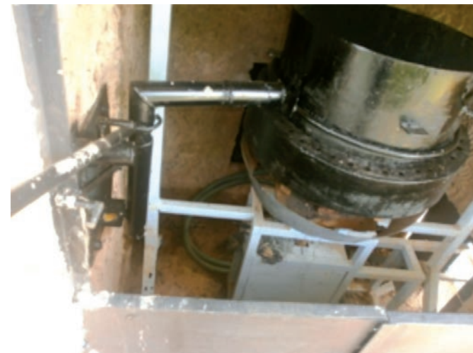
Figure 5 : aperçu de la marmite

En lieu et place de la marmite en aluminium, un autre type de marmite a été conçu pour augmenter la quantité de matériaux. Cette marmite qui accueille les sachets est de forme cylindrique avec un corps et un fond en tôle noire de 3 mm. L'ensemble est destiné à recevoir le mélange plastique et sables lors de la fonte.