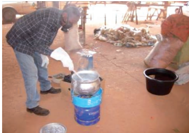
Figure 2 : Premiers tests de fonte au Département des Technologies Appropriées du CEAS Burkina en 2008

Cette expérimentation a permis entre autre de tester les différentes techniques artisanales de fabrication d'objets à base de sachets plastiques recyclés, l'utilisation d'additifs dans la fabrication d'objets à base de sachets plastiques recyclés tel que le sable; d'estimer les coûts de production de certains objets à base de sachets plastiques recyclés et d'apporter des améliorations ou des innovations aux techniques artisanales.