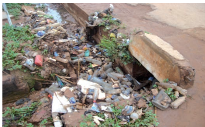
Figure 1 Encombrement des caniveaux par les déchets en général, et les sachets plastiques en particulier

Des initiatives de collecte sont organisées de temps en temps, mais le gouvernement qui en est l'auteur, peine à trouver une utilisation adéquate à ces sachets plastiques dont une importante quantité est stockée dans les villes secondaires.