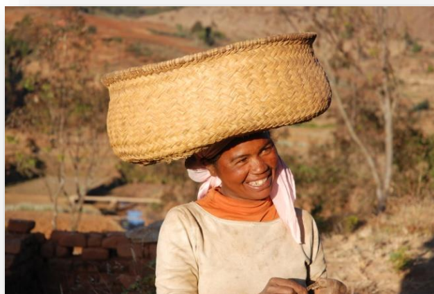
Le légendaire sourire de la population malagasy !